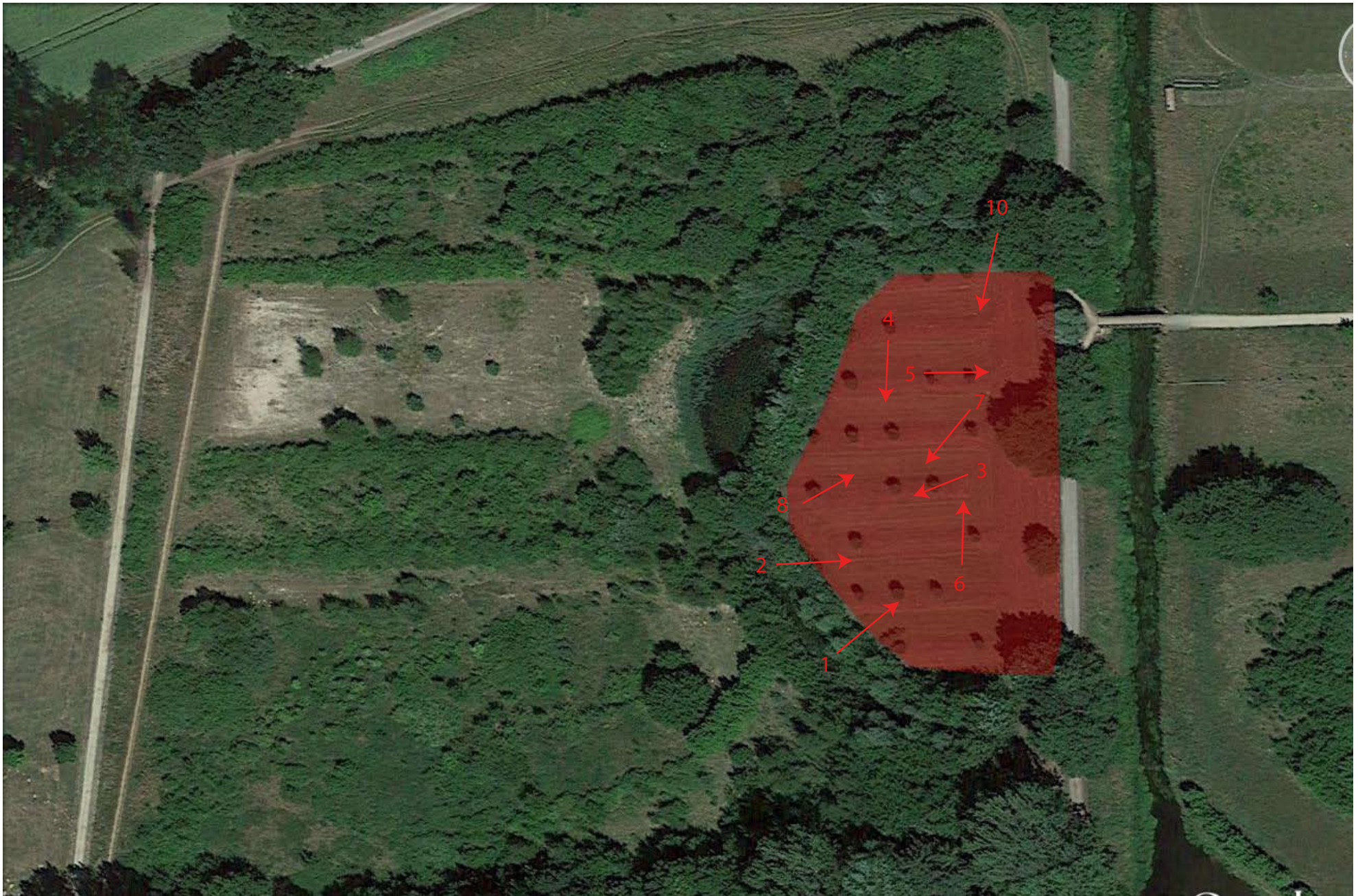
Pfeile zeigen Richtung der Fotoaufnahmen / Arrows show direction of photography