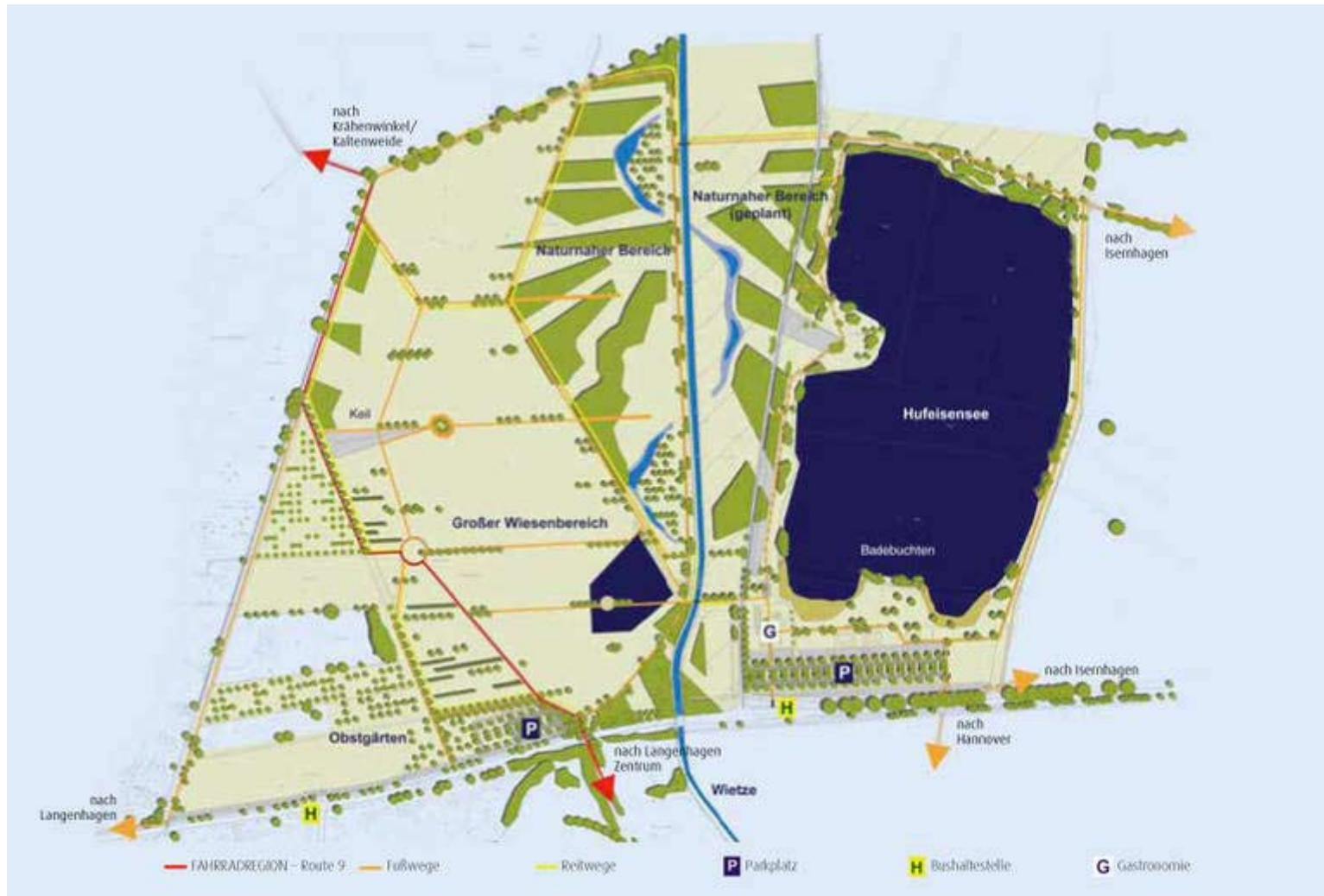
Plan des Wietzpark / Plan of the Wietzpark