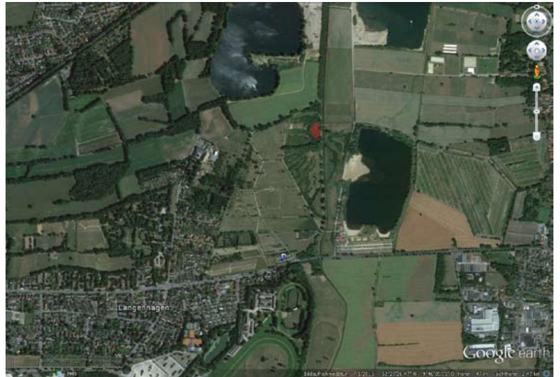
Luftbild mit Gelände für Installation (rot) Aerial photo showing the area for art (red)