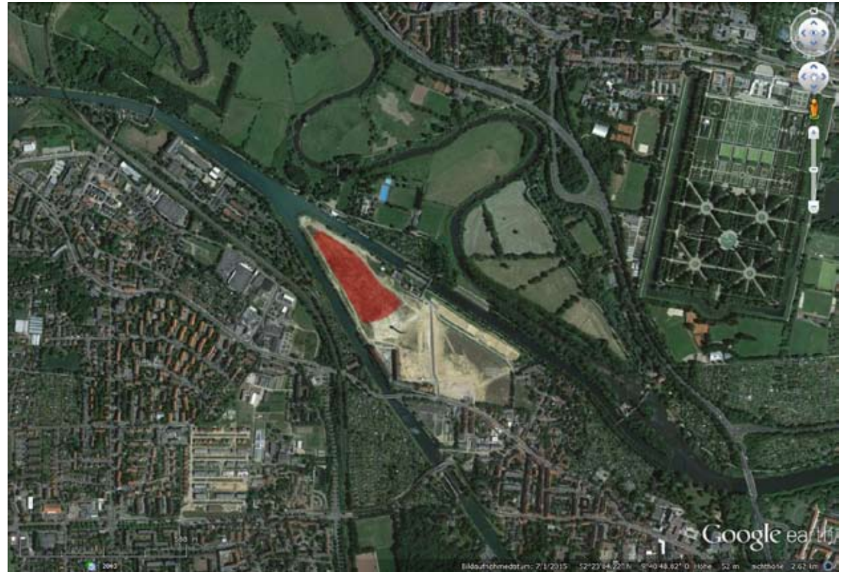
Luftbild mit Gelände für Installation (rot) Aerial photo showing the area for art (red)