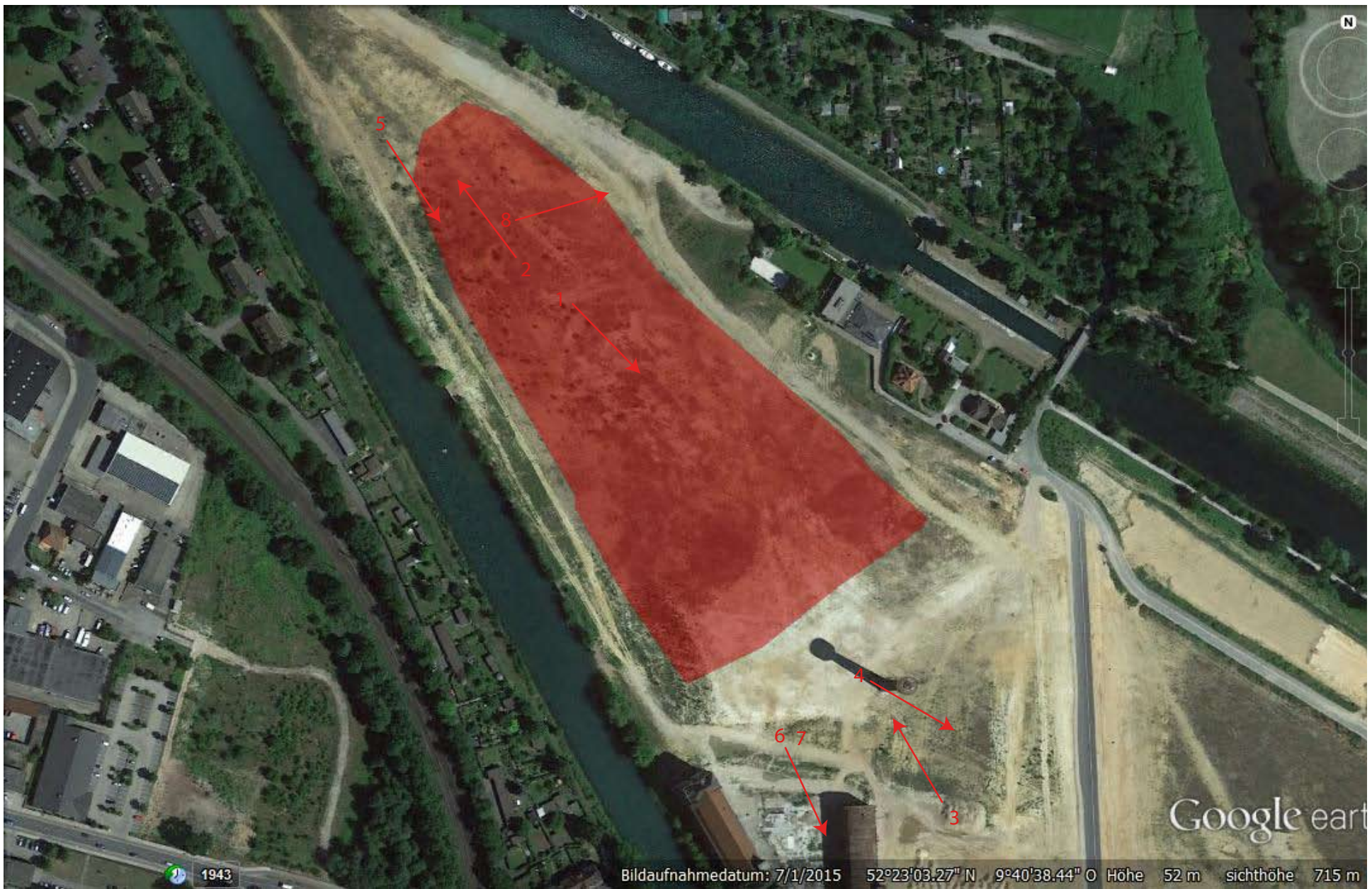
Pfeile zeigen Richtung der Fotoaufnahmen / Arrows show direction of photography