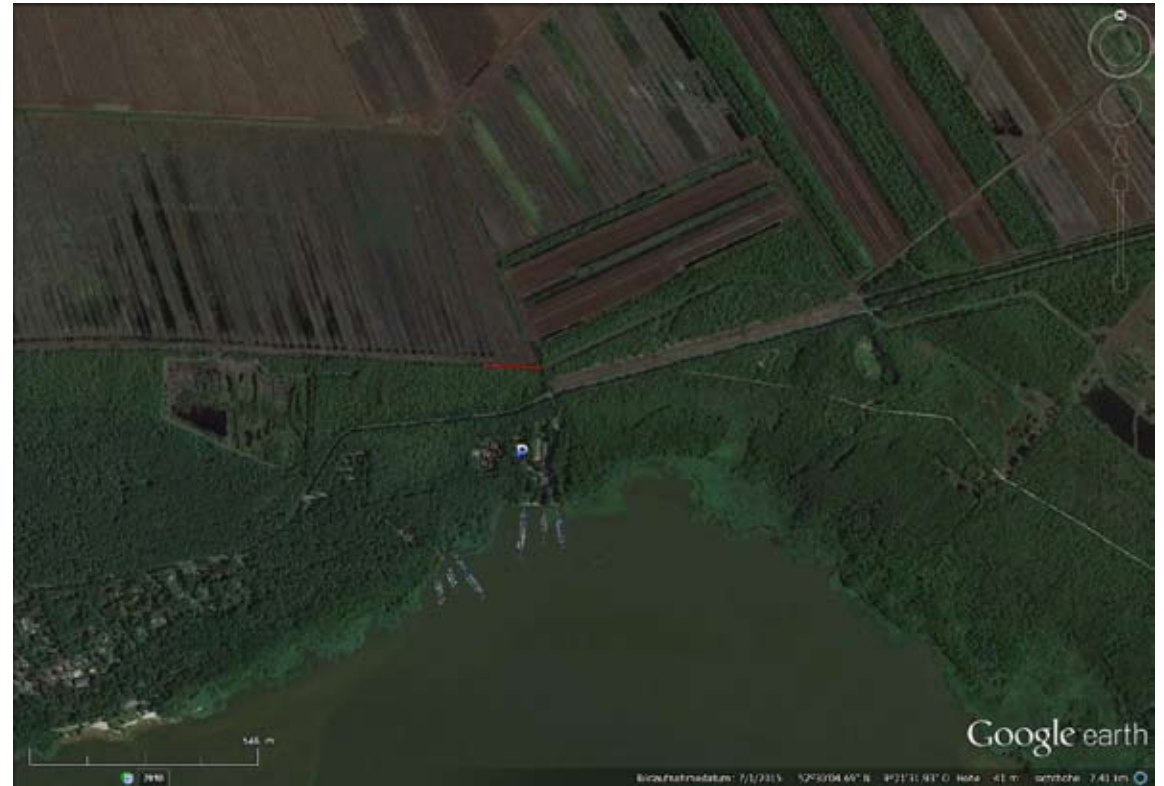
Luftbild mit Gelände für Installation (rot) Aerial photo showing the area for art (red)