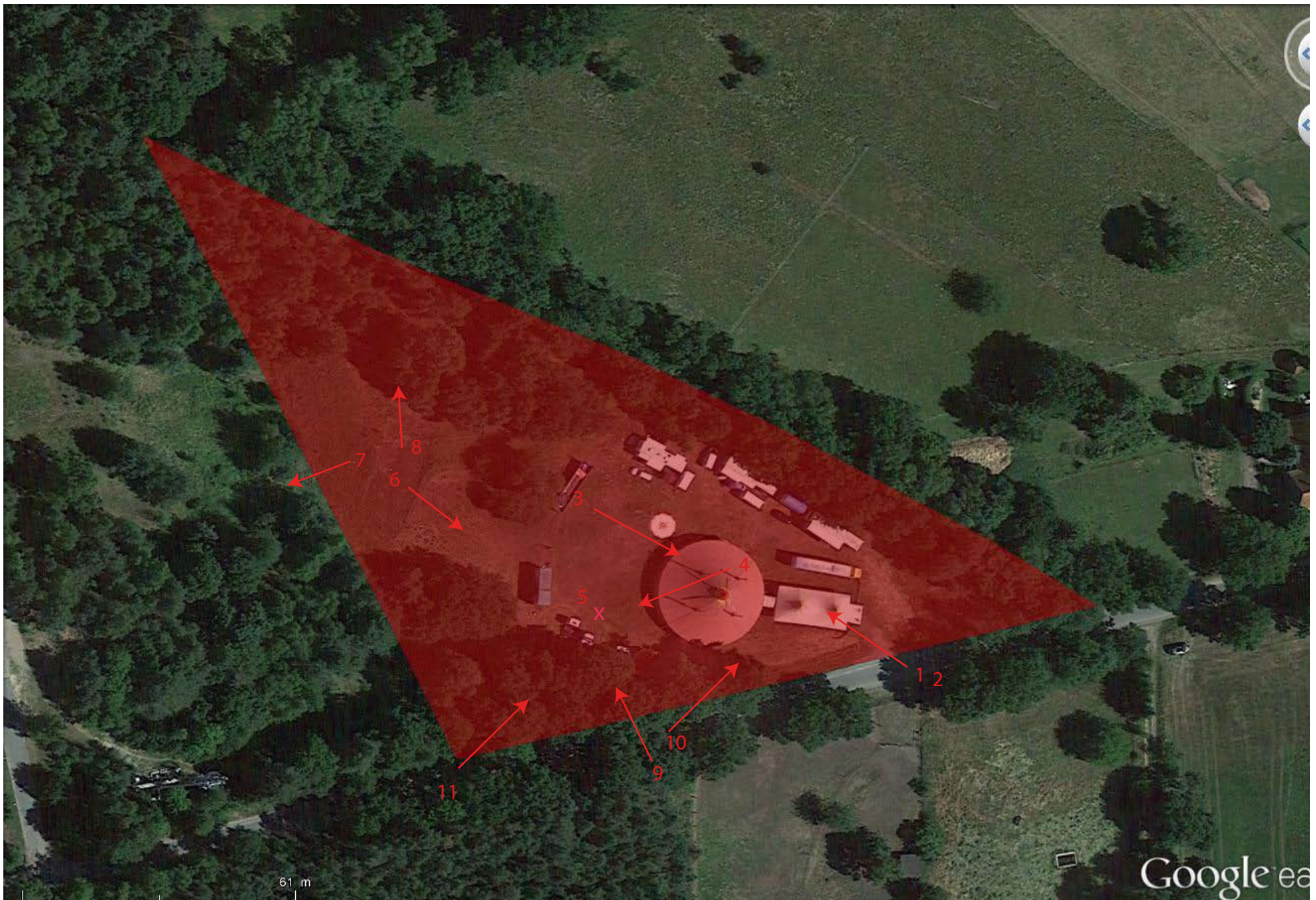
Pfeile zeigen Richtung der Fotoaufnahmen / Arrows show direction of photography