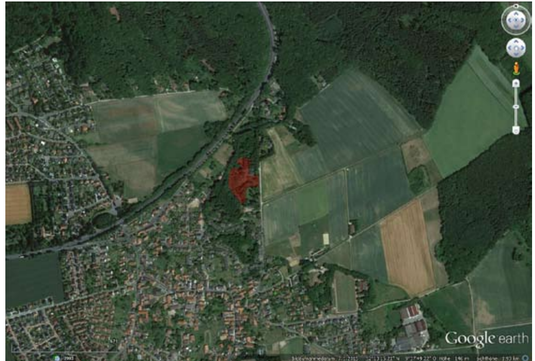
Luftbild mit Gelände für Installation (rot) Aerial photo showing the area for art (red)