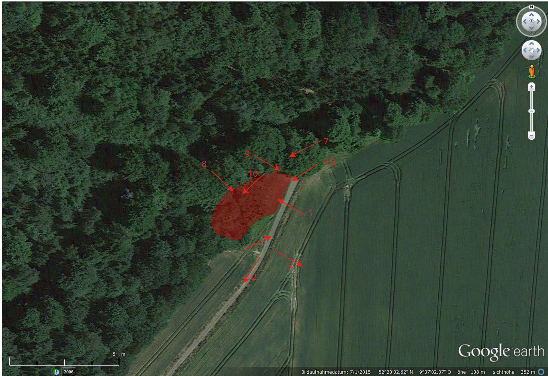
Pfeile zeigen Richtung der Fotoaufnahmen / Arrows show direction of photography