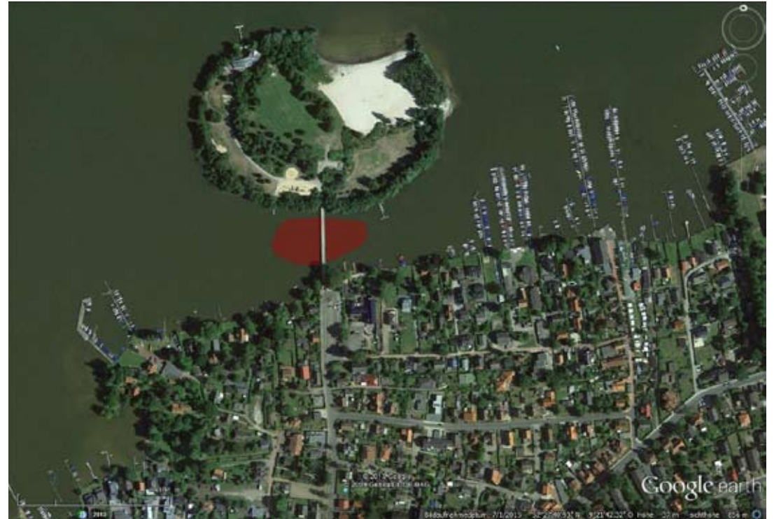
Luftbild mit Gelände für Installation (rot)